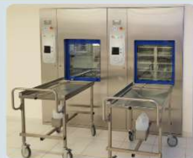
FECHAMENTO DE AUTOCLAVE

***Imagens meramente ilustrativas, disponível em acabamento escovado ou polido, fabricados sob medida para atender todas as suas necessidades.