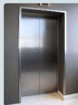
BATENTE DE ELEVADOR

***Imagens meramente ilustrativas, disponível em acabamento escovado ou polido, fabricados sob medida para atender todas as suas necessidades.