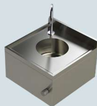
PIA DE ASSEPSIA