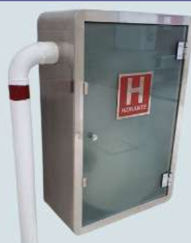
CAIXA PARA HIDRANTE