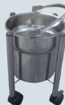
BALDE DE CHUTE