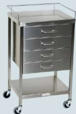
CARRINHO DE TRANSPORTE