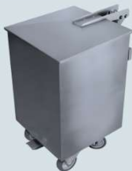
CARRO DE DETRITOS